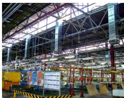
❖ Характеристики приточного воздуха в зависимости от уличного

Испарительные охладители обеспечивают помещения свежим, охлаждённым, увлажнённым и очищенным воздухом. При этом через открытые окна, двери или вытяжные вентиляторы удаляются избытки тепла, дыма и неприятных запахов. Идеальное место установки, если позволяет пространство, находится на крыше или же сбоку здания с расположением воздухораспределителя вдали от окон. Открытые окна, расположенные вдали от воздухораспределителя, позволяют охлаждённому воздуху проходить через всё помещение. Правильно рассчитав площадь окон и дверей, которые должны быть открыты, можно достичь максимальной эффективности системы.