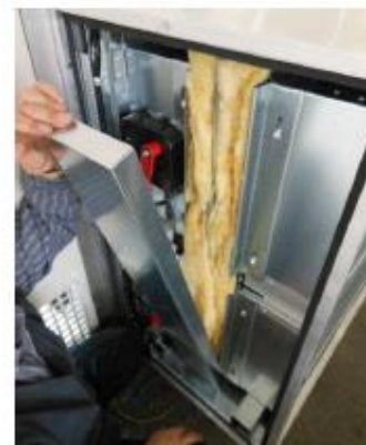
заслонки с обогревом