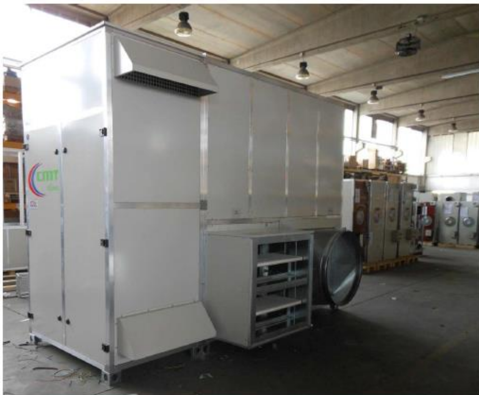
GR с повышенной теплоизоляцией (панелями 45 мм)