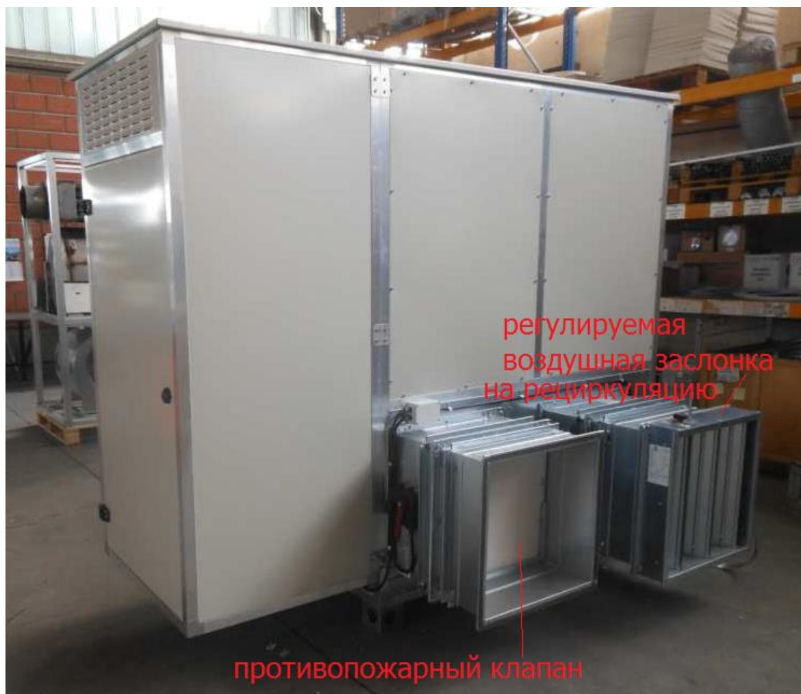
регулируемая воздушная заслонка на рециркуляцию