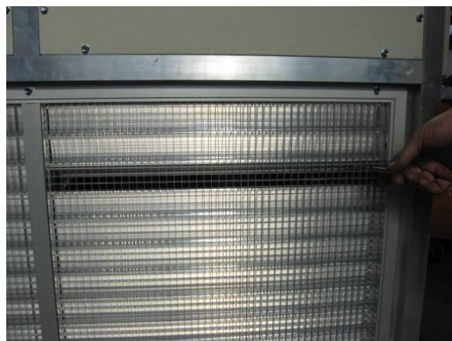
Воздушная заслонка рециркулируемого воздуха с ручной регулировкой

Воздушная заслонка избыточного давления, предназначена для использования с воздухоопорными сооружениями (ВОС). Нормально закрытая, открывается по сигналу датчика давления при превышении давления вне ВОС давления внутри.